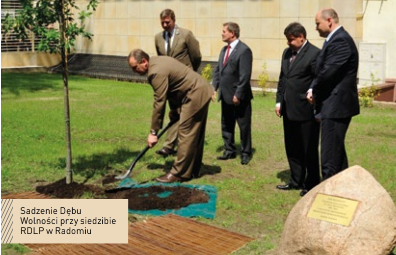
Sadzenie Dębu Wolności przy siedzibie RDLP w Radomiu