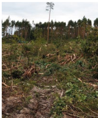
W tak ciężkich warunkach sprawdzili się harwestery