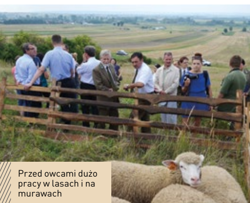
Przed owcami dużo pracy w lasach i na murawach