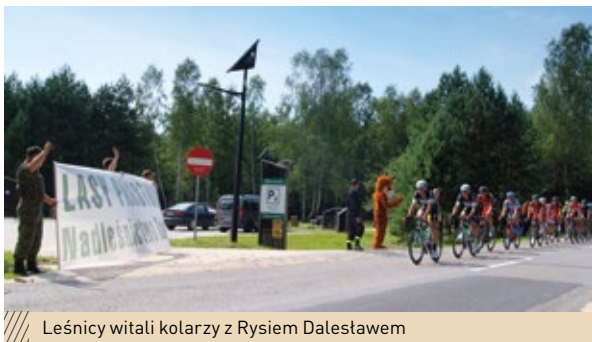
Leśnicy witali kolarzy z Rysiem Dalestawem

Przez tereny Nadleśnictwa Daleszyce przejechał barwny peleton Tour de Pologne. Leśnicy wraz z Rysiem Dalestawem dopingowali zawodników na trasie.