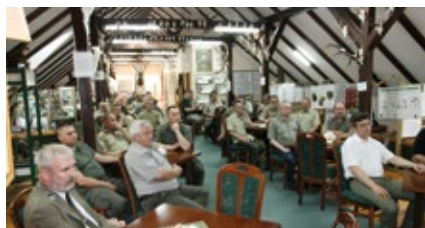
Wymiana doświadczeń w Nadleśnictwie Oborniki

Nowe zarządzenie o szacunkach brakarskich oraz prace nad planem pozyskania drewna i ofertą sprzedaży na rok 2015 były pretekstem do narady wyjazdowej. Grupa leśników z naszej dyrekcji 11 i 12 czerwca gościła na terenie RDLP w Poznaniu.