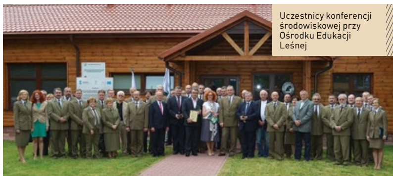
Uczestnicy konferencji środowiskowej przy Ośrodku Edukacji Leśnej

Wiele ostatnich wydarzeń na terenie RDLP w Radomiu miało związek z podejmowaniem wspólnych działań leśników i instytucji zainteresowanych leśnictwem, ochroną przyrody, turystyką oraz edukacją. Ich celem jest realizacja działań na rzecz leśnictwa finansowanych ze środków zewnętrznych. Przegląd tych wydarzeń uświadamia nam, że praca leśników związana z poszukiwaniem, aplikowaniem i rozliczaniem projektów z zewnętrznych źródeł finansowania jest nieunikniona, a współpraca z instytucjami związanymi z leśnictwem i ochroną przyrody daje korzyści dla wszystkich stron i społeczeństwa.