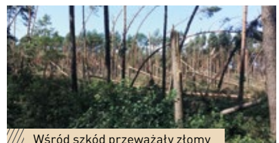
Wśród szkód przeważały złomy