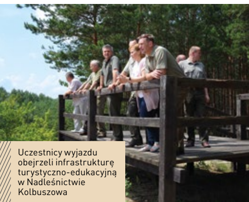
Uczestnicy wyjazdu obejrzeli infrastrukturę turystyczno-edukacyjną w Nadleśnictwie Kolbuszowa