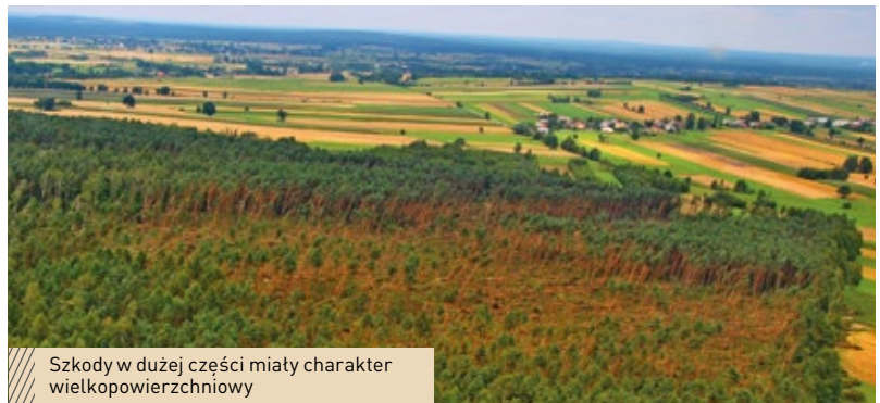
Szkody w dużej części miały charakter wielkopowierzchniowy