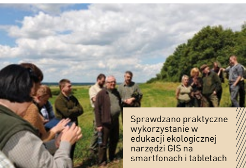
Sprawdzano praktyczne wykorzystanie w edukacji ekologicznej narzędzi GIS na smartfonach i tabletach