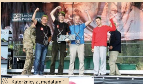
Katorżnicy z „medalami”

Dwóch pracowników nadleśnictw naszej dyrekcji reprezentowało Lasy Państwowe w jednym z najtrudniejszych w Europie biegu - Biegu Katorznika.