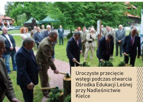
Uroczyste przecięcie wstęgi podczas otwarcia Ośrodka Edukacji Leśnej przy Nadleśnictwie Kielce